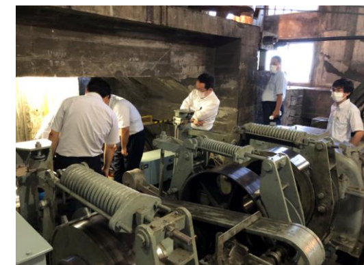
予備原動機による運転取扱訓練