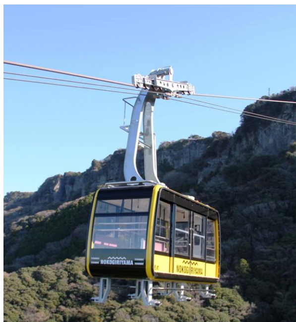
東京ドイツ村ウィンターイルミネーションと鋸山ロープウェー

この券は、東京ドイツ村と鋸山ロープウェー両施設を利用できる共通チケットをお得な価格で提供する事により、両施設間の周遊を促すことを目的として発売するものです。