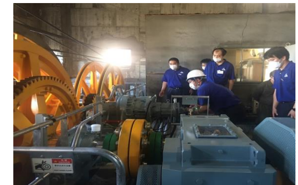
予備原動機による運転取扱訓練