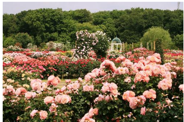
京成バラ園（千葉県八千代市）

この取り組みは、鋸山ロープウェーの所在地である富津市金谷と京成バラ園（千葉県八千代市）がそれぞれ「恋人の聖地」に認定されていることにちなみ、相互PRを展開することで観光客の誘致と地域活性化を目指すものです。